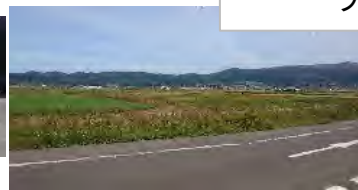
ラベンダーの新幹線乗車