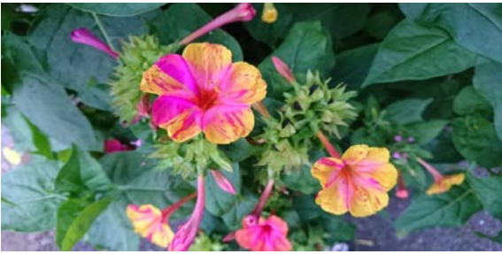
白粉花（おしろいばな）

別名 「夕化粧」（ゆうげしょう）。 名のとおり、夕方から咲く。 ピンクに黄色にオレンジ色鮮やか