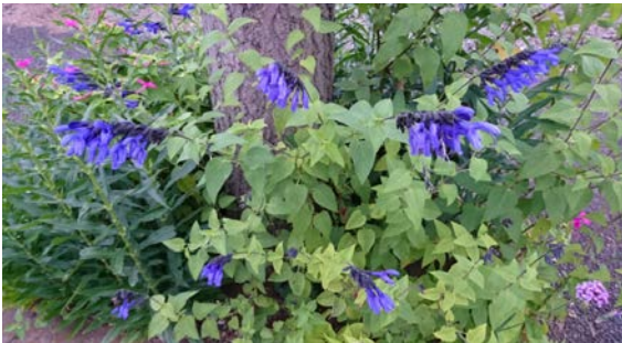
サルビアガラティカ

アメジストセージ：サルビアレウカンサ、メキシカンセージ メキシカンブッシュセージ 呼び名いろいろです サルビアは赤だけとってた。