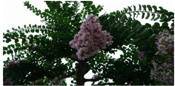
百日紅（さるすべり）

別名 「夕化粧」（ゆうげしょう）。 名のとおり、夕方から咲く。 ピンクに黄色にオレンジ色鮮やか